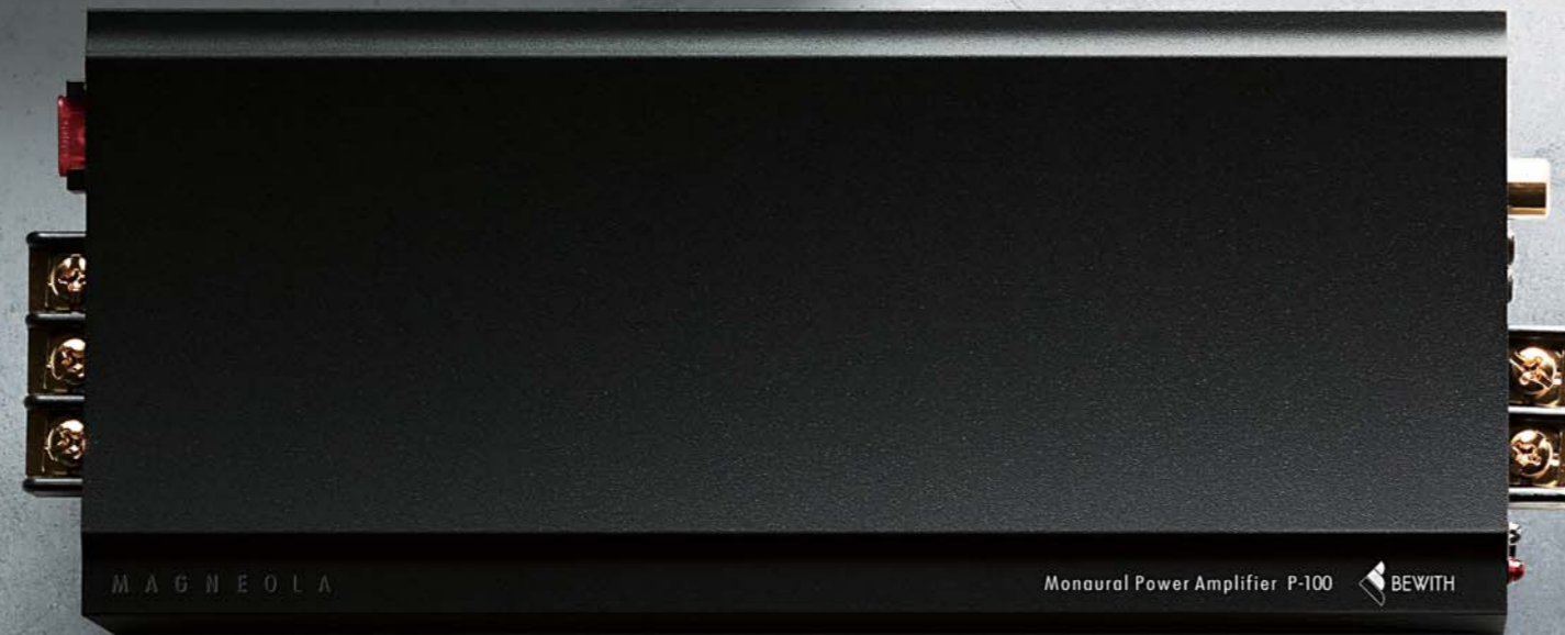
Monaural Power Amplifier P-100 NEW

モノラルパワーアンプ P-1: 定格出力100W・音質最優先のディスクリート構成アナログパワーアンプでありながら、音響専用マグネシウム合金ボディ「MAGNEOLA」や独自の低発熱・低消費電力技術によって、わずか620gという超軽量化を達成したフラッグシップ機。新日本無線（株）と共同開発した音響専用オペアンプIC、BSZ1型やSiCダイオードMUSES7001、ステージ間分離パワーサプライの採用により、圧倒的な音楽表現力と駆動力、S/N感を獲得しました。