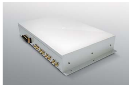
Digital Processor DA Converter Mirror Station® AZ-1