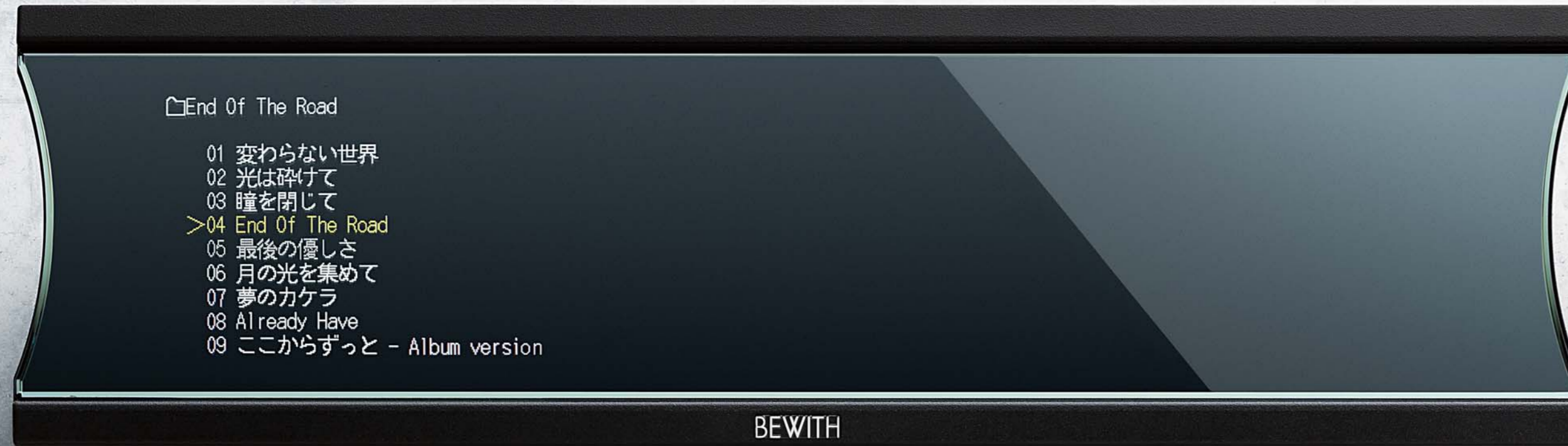
Linear PCM Player STATE MM-1D