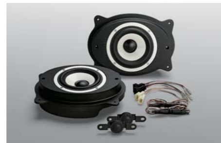
Dedicated Speaker package B-1300AAP for ALPHARD/VELLFIRE NEW