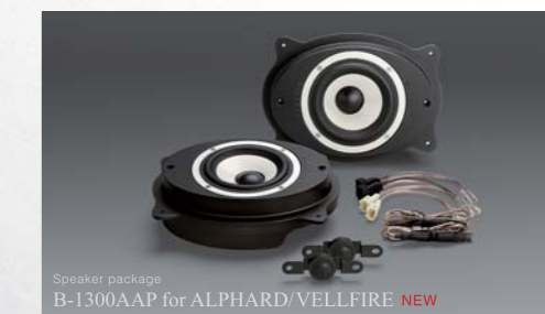
Speaker package B-1300AAP for ALPHARD/VELLFIRE NEW