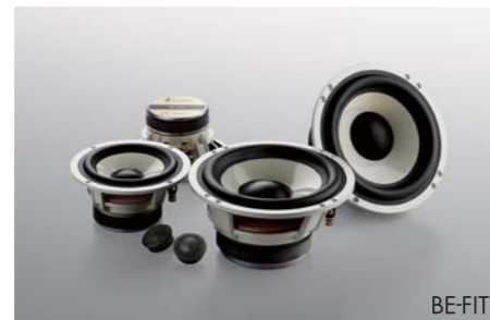
Speaker system B-1300U / B-180 ■ 13cm 2Way Speaker System / B-1300U ■ 18cm Subwoofer / B-180