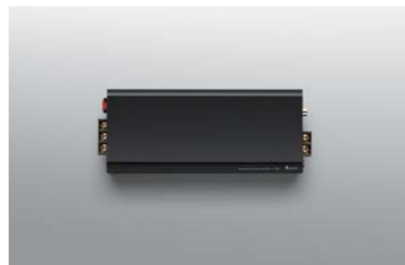
Monaural Power Amplifier P-100 NEW