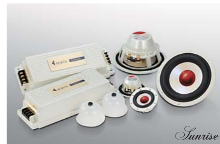
Speaker system Confidence II Sunrise C-50 II Sunrise / C-130 II Sunrise / C-180 II Sunrise ■ 13cm Component Separate 2way System / Confidence II Sunrise ■ 5cm Tweeters / C-50II Sunrise ■ 13cm Midwoofers / C-130II Sunrise ■ 18cm Subwoofer / C-180II Sunrise