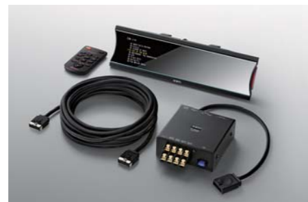
Linear PCM Transport Package MM-1DT NEW ■ Linear PCM Player / STATE MM-1D ■ High Sound Quality Link Cable / ML Link Cable ML-6.0 ■ Interface Unit / IF-10M