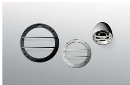
Grille & Enclosure G-50 / G-130 / G-180 ■ Aluminium Diecast Tweeter Enclosure / G-50B/50W ■ Aluminium Diecast Midwoofer Grille / G-130B/130W ■ Aluminium Diecast Subwoofer Grille / G-180B/180W