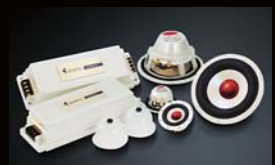
Confidence II Sunrise