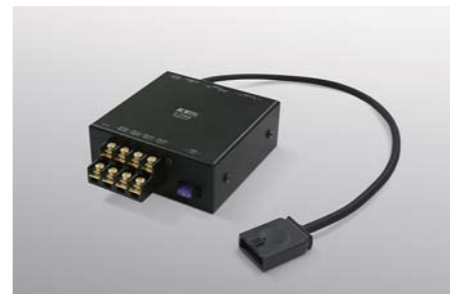
Interface Unit IF-10MM NEW