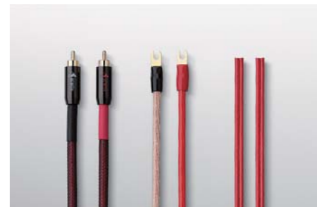
BEWITH Original Cable Line Cable NEW Power Cable NEW ■ LC-1.0a ■ LC-2.0a ■ PC-5aCLR / PC-5aRED ■ LC-5.0a ■ PC-9aCLR / PC-9aRED RCA Plug NEW Speaker Cable NEW ■ LP-4a ■ SP-14a