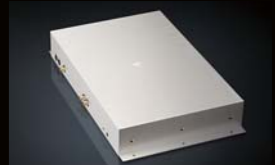
AZ-1 & AZ-2