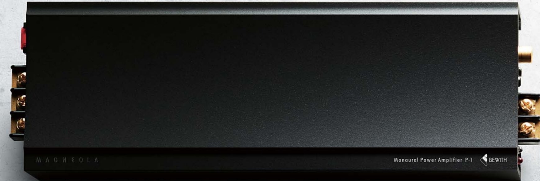
Monaural Power Amplifier P-1 NEW