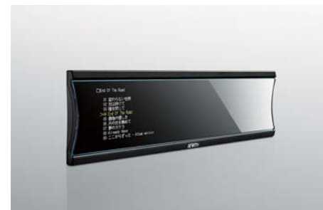
Linear PCM Player STATE MM-1D