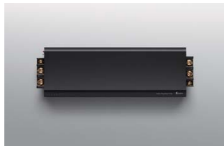
Audio Regulator V-50 NEW