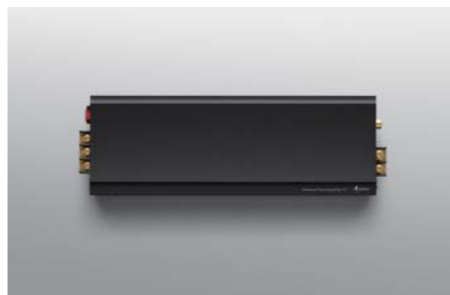
Monaural Power Amplifier P-1 NEW