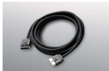
High Sound Quality Link Cable ML Link Cable ■ ML Link Cable ML-0.5 0.5m ■ ML Link Cable ML-3.0 3.0m ■ ML Link Cable ML-6.0 6.0m