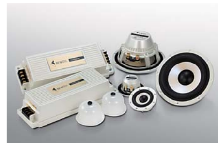
Speaker system Confidence II / C-50 II / C-130 II / C-180 II ■ 13cm Component Separate 2way System / Confidence II ■ 5cm Tweeters / C-50II ■ 13cm Midwoofers / C-130II ■ 18cm Subwoofer / C-180II