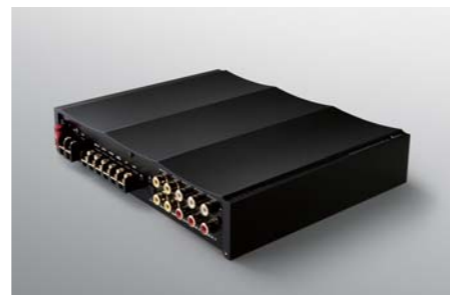
Multiprocessing DAC System STATE A6 NEW