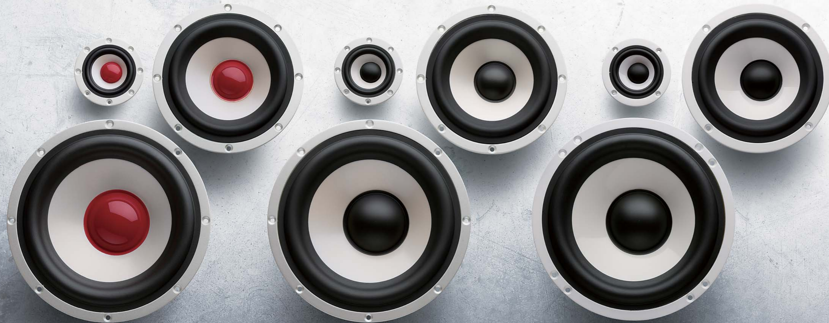
Confidence II Sunrise C-50 II Sunrise / C-130 II Sunrise / C-180 II Sunrise