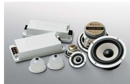
Speaker system Accurate II / A-50 II / A-130 II / A-180 II ■ 13cm Component Separate 2way System / Accurate II ■ 5cm Tweeters / A-50II ■ 13cm Midwoofers / A-130II ■ 18cm Subwoofer / A-180II