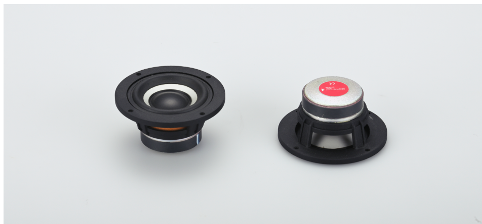
BEWITH Lucentシリーズ 5cmワイドレンジツイーター「L-50L」(2本1組)

※本製品にネットワークは付属していません。また、本製品に適合する砲弾型エンクロージャ「G-50AS」標準価格22,000円(税込/ペア)を本日2月28日より発売いたします。詳しくは同日発行のプレスインフォメーションをご覧ください。