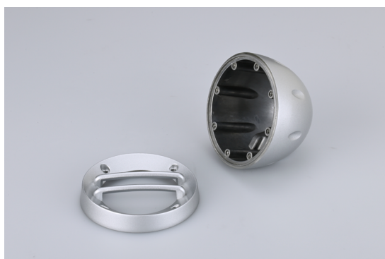
「G-50AS」の前後2ピース構造

車室内でのより自由なレイアウト*のために熟慮されたエンクロージャ形状、視覚的なアクセントともなる側面周囲8個所のディンプル部など、上級機「G-50MG」で確立した外観デザインを継承。外装色には、あらゆる色調のインテリアに合わせやすい新色「アストラルシルバー」を採用しました。 *取り付けの際はエアバッグなど車両の安全装置の作動の妨げにならないよう、また運転の支障や乗員の怪我の原因にならないよう、安全に十分ご配慮のうえ装着位置や装着方法などを決定してください。