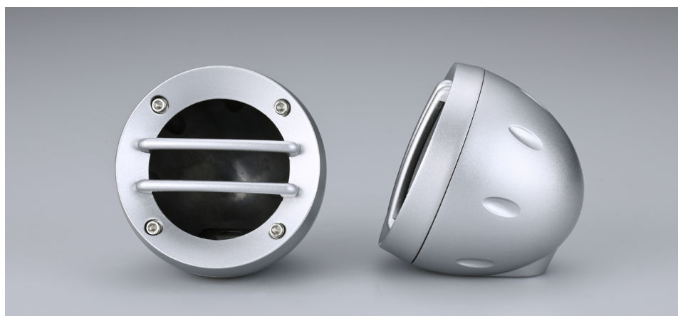
BEWITH スピーカーアクセサリ 砲弾型エンクロージャ「G-50AS」(2個1組) 外形寸法W78×H78×D70mm、質量140g(1個あたり)、ユニット&グリル用ネジ8個、底面固定用ネジ3個付属

砲弾型エンクロージャ「G-50AZ」 標準価格 2万4200円(税込/ペア) 取付費別 (ZEN50PPC専用)